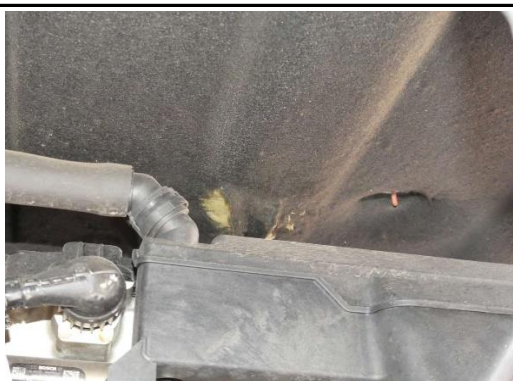
Dämmstoffmatte Motorraum gerissen