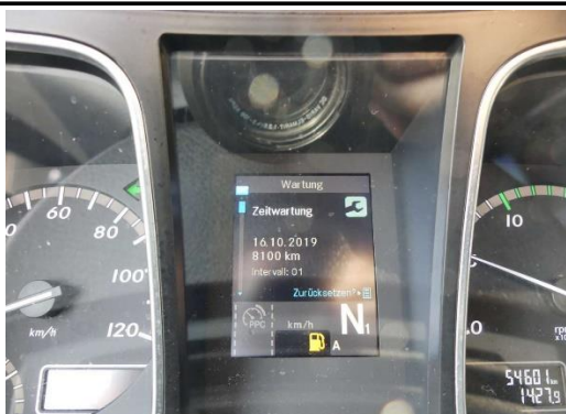
Wartung, Restlauf 8.100 km