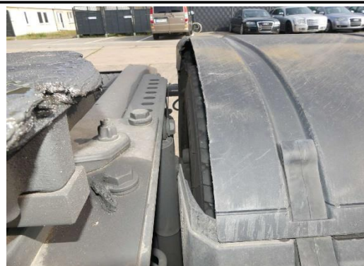
Radabdeckung 2. Achse links gebrochen