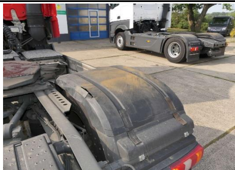
Radabdeckung 2. Achse rechts gebrochen