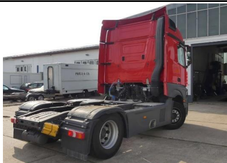
Ansicht hinten rechts