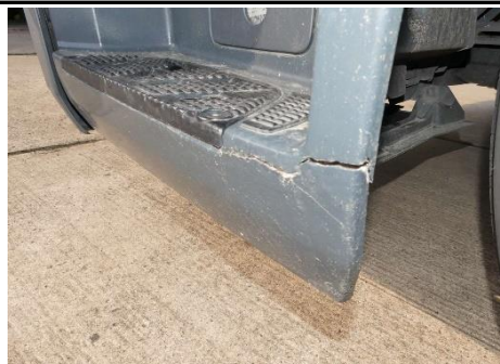
Einstieg unten links gebrochen