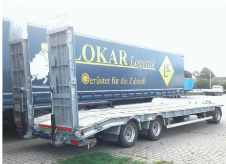
Ansicht hinten rechts