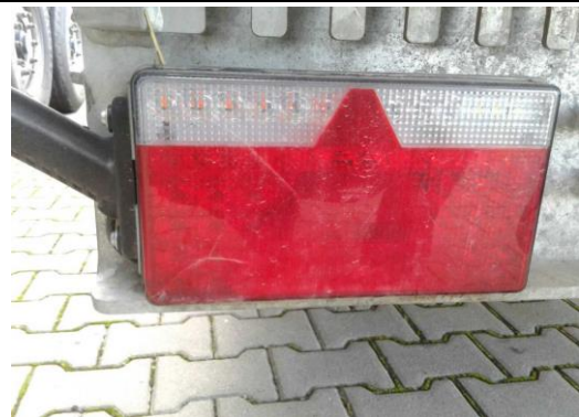
Heckleuchte L Glas gebrochen