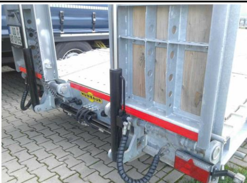
Ansicht Hydraulikzylinder Auffahrampen