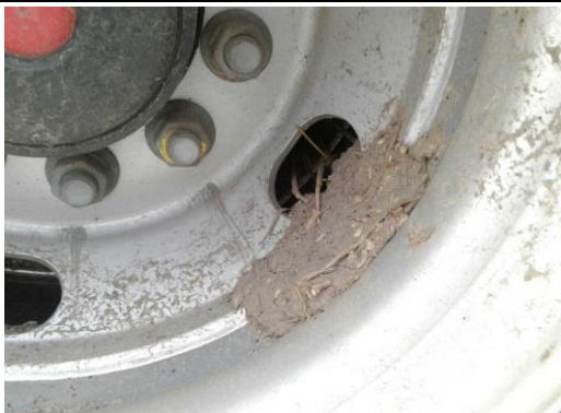
Rahmen / Felgen stark verschmutzt