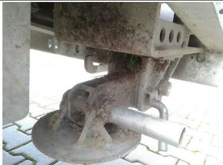
Rahmen / Unterboden stark verschmutzt