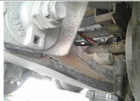
Rahmen / Unterboden stark verschmutzt