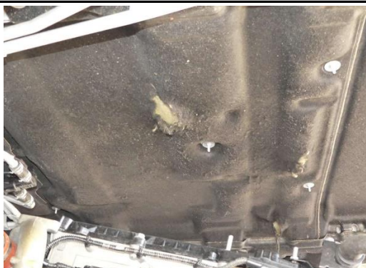
Dämmstoffmatte Motorraum gerissen