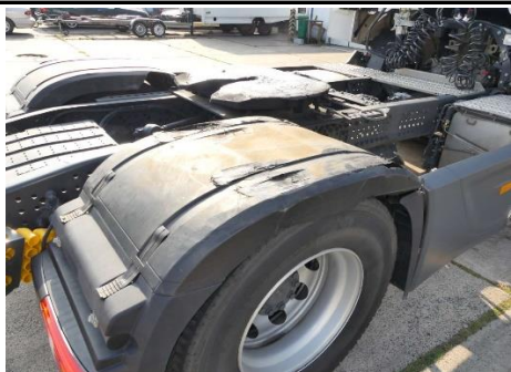
Radabdeckung 2. Achse rechts gebrochen