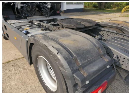
Radabdeckung 2. Achse links gebrochen