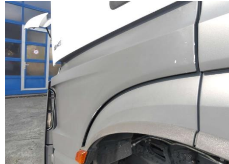
Türverlängerung links Kratzer