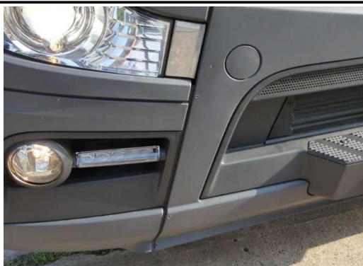
Löcher Stoßfänger VR unten