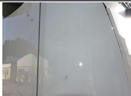
Luftleitkörper VR verkratz