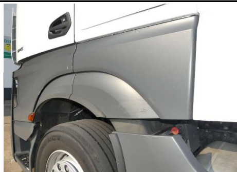
Blende Radlauf vorne links hin gebrochen