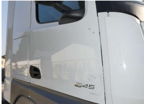
Tür rechts verformt, verkratzt