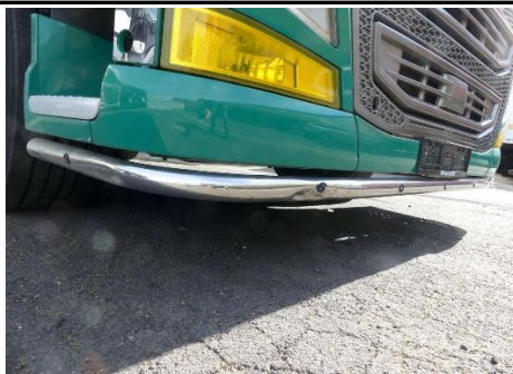
Stoßreling Stoßfänger vorne verformt, verschürft