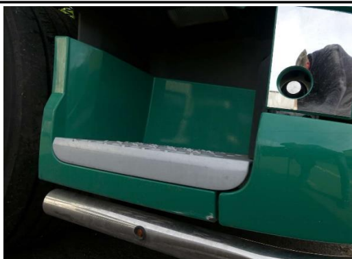
Einstieg unten rechts verschürft