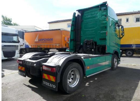
Ansicht hinten rechts