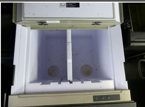
Kühlbox verschmutzt, naß