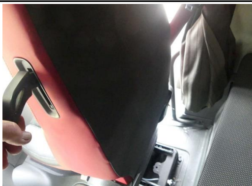
Lehnenbetätigung Sitz rechts ohne Funktion