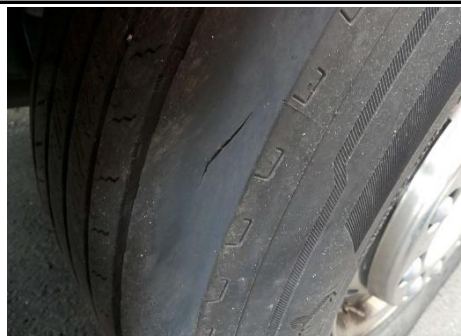
Reifen VL Schnittbeschädigung Lauffläche