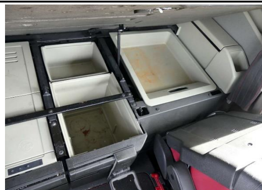
Ablagefächer unter Liege verschmutzt